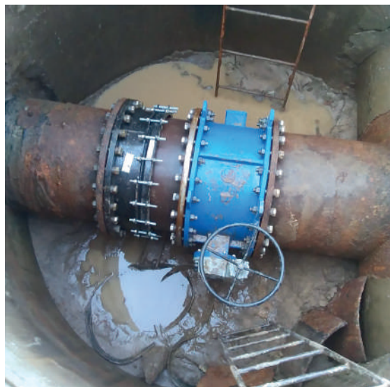
Новая запорно-регулирующая арматура установлена!