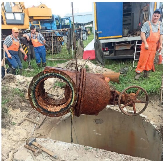
Старая ЗРА поднята на поверхность

Большинство горожан с пониманием отнеслись к данной ситуации. Ведь на кону – улучшение системы водоснабжения, а значит их комфорт. Замена других ЗРА на улицах Алебастровая и Балахнинская произошла 14 сентября.