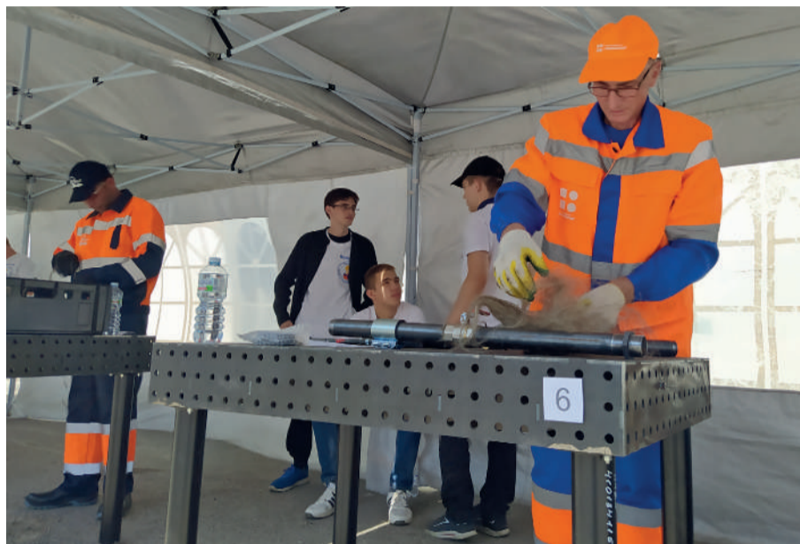
Практическая часть соревнований