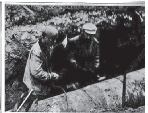
УСТРОЙСТВО ТРАНСИТНОЙ КОЛОДЕЦНОЙ Д-800 мм НА УЛ. БЕНДИНСКОЙ.