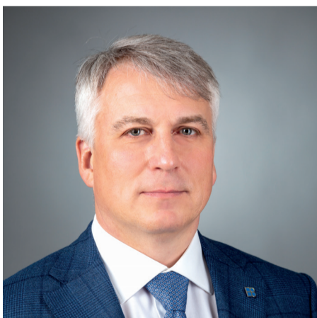
Окончание. Начало на стр. 1.

Так в Автозаводском районе, в частности, будет восстановлен коллектор на ул. Строкина. Там у дома №3 произошла просадка узлового канализационного колодца с примыкающими трубопроводами Д=600 мм и Д=200 мм, что привело к провалу на тротуаре. Ремонтные работы (перекладка части коллектора) позволят восстановить нормальное водоотведение от 43 жилых многоквартирных домов, 5 детских садов, 3 школ, 1 административного здания.